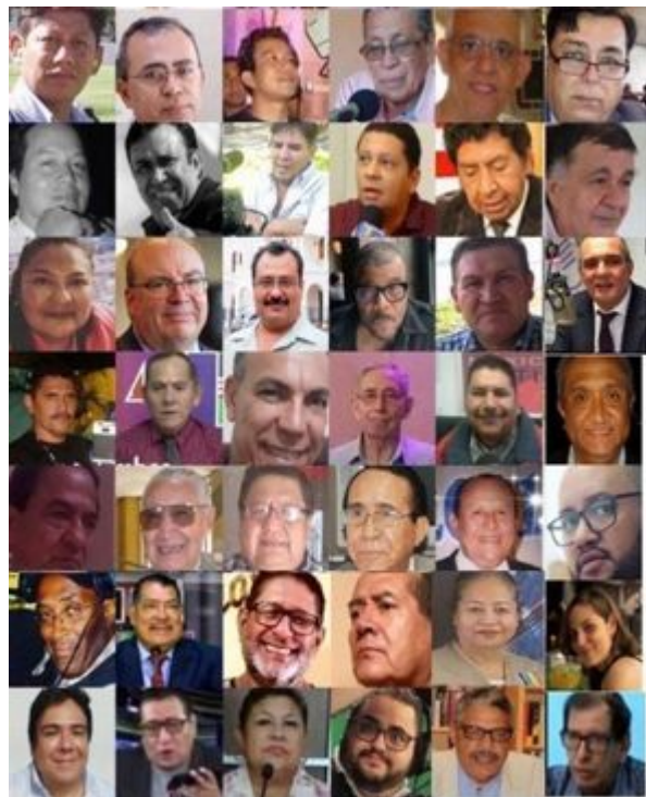
Trabajadores de la Prensa Víctimas del Covid-19 en América Latina y el Caribe

* Material a profundidad sobre cómo la COVID -19 ha afectado las vidas de periodistas y otros trabajadores de la prensa en República Dominicana.