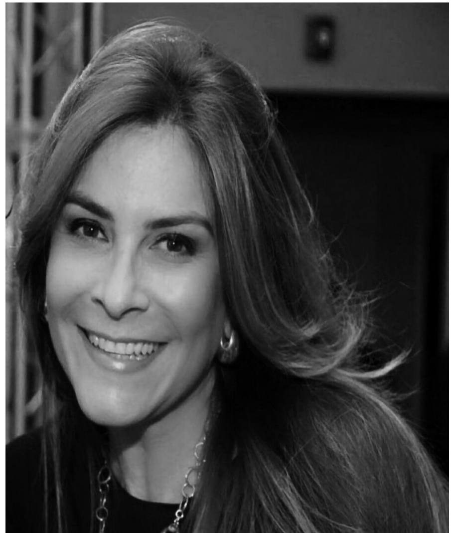
Carolina Mejía, Alcaldesa del Distrito Nacional

La alcaldesa Mejía tuvo la cortesía de pedir a los y las participantes que escucharan al ciudadano, brevemente, y así fue que Aponte en voz alta y resonante dijo que: "Yo soy Miguel Aponte Viguera y como ciudadano y periodista les expreso que el Plan de Seguridad Ciudadana que se presentaba con otro nombre, ha fracasado y es de origen colombiano implementado por el Gobierno de Leonel Fernández con